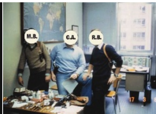
DIE POLIZISTEN M. B. UND R. B. WURDEN VERWÜNSCHTE SICH EIN LIED FÜR DIE KILLER