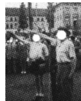
HATTEN DIE KILLER VERBINDUNGEN ZU DEN NEONAZIS, DIE BELGIEN IN DEN 80ER JAHREN TERRORISIERTEN?

Die Brabant-Killer bleiben ein Rätsel. Die Täter werden nie gefasst. Nicht einmal ein plausibles Tatmotiv kann in all den Jahren gefunden werden. Warum ermorden militärisch geschulte Verbrecher so viele Menschen für so wenig Beute? Waren die Überfälle mit all den Toten nur ein Ablenkungsmanöver, um die wahren Ziele zu vertuschen? Doch was waren das für Ziele? Gab es unter den 28 Opfern Personen mit Verbindungen in die Unterwelt, die exekutiert werden sollten? Und warum endeten die Verbrechen so plötzlich? 2015 hätten die Ermittlungen eingestellt werden sollen. Doch sie wurden um weitere zehn Jahre verlängert. —>