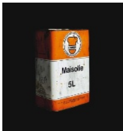
FRITTIERÖL: TEIL DER BESCHEIDENEN BEUTE EINES BESONDERS BRUTALEN ÜBERFALLS. // MAULWÜRFE: DÄCHTIGT, VERBINDUNGEN ZU DEN VERBRECHERN ZU HABEN. // TODESMUSIK: EIN ANONYMER ANRUFER

Mit ihrer vollkommenen Skrupellosigkeit brennen sich die Killer ins Bewusstsein der Belgier ein. 1982 überfallen sie zwei Tage vor Weihnachten ein abgelegenes Restaurant, fesseln den Besitzer an sein Bett und schießen ihm acht Ku-