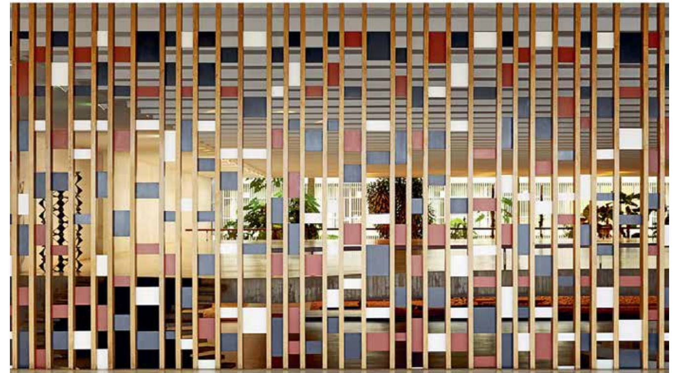
10 — The Itamaraty Palace Foreign Relations Ministry, wood and steel panel by Athos Bulcão, 2012