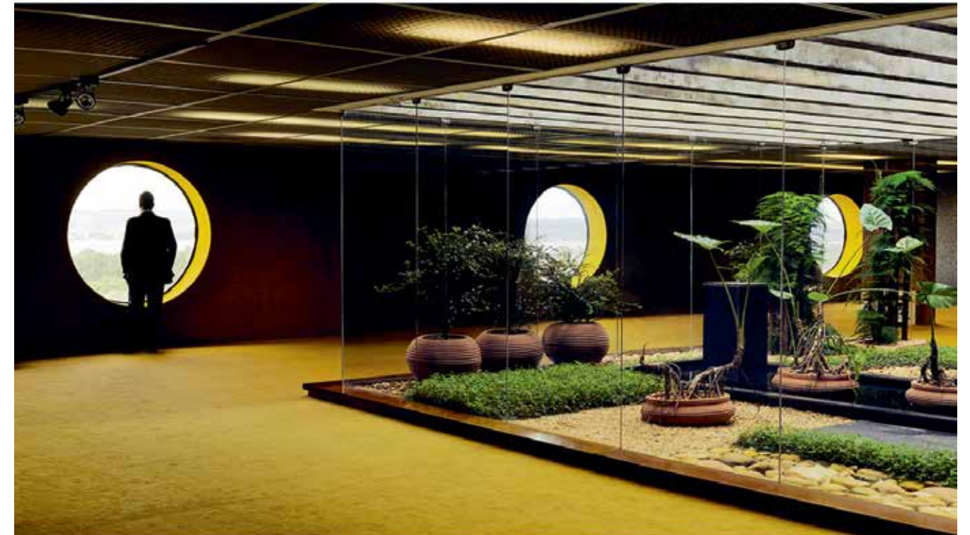
5 — Deputies Chamber Annex IX #2, 2012