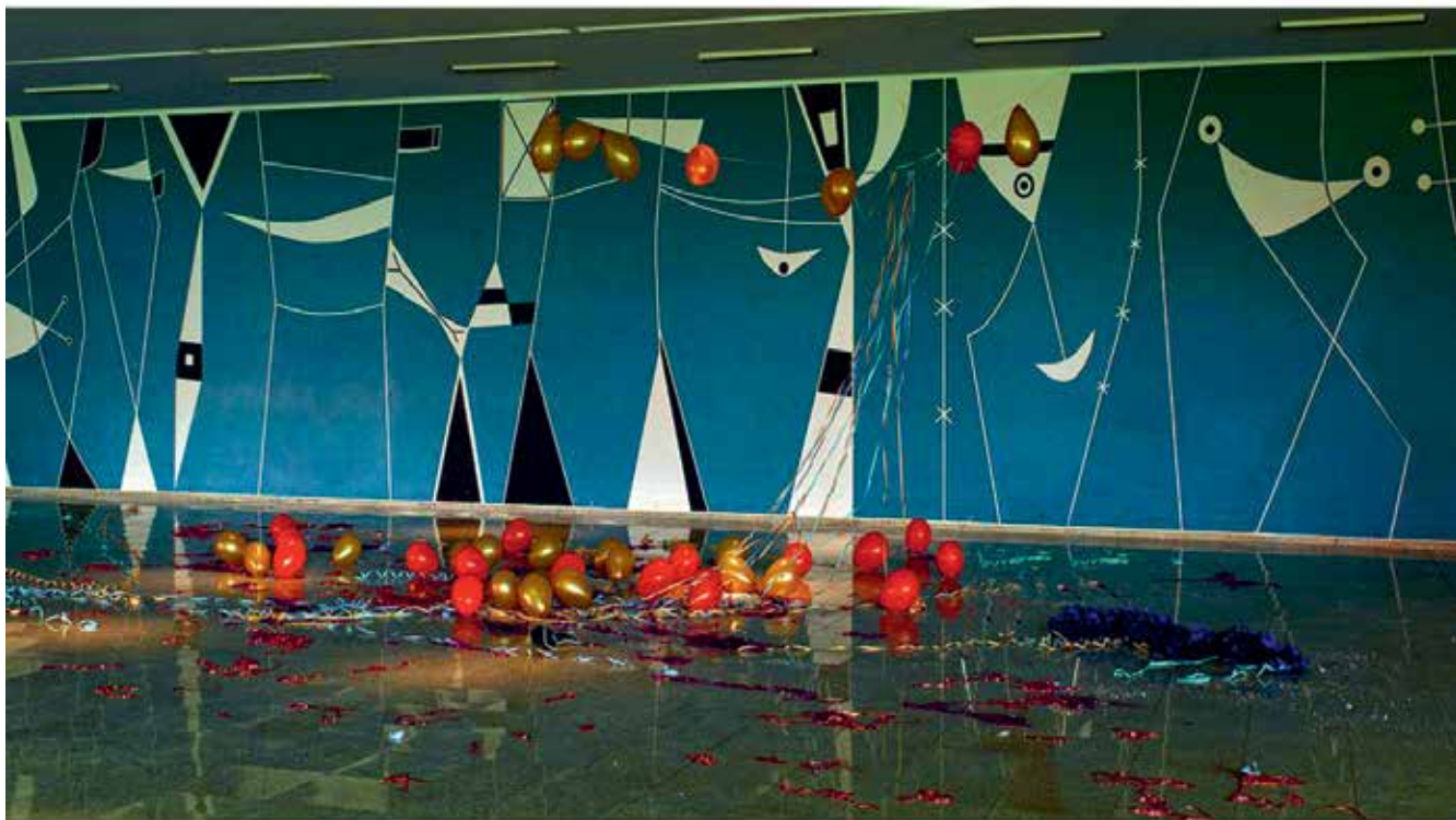
9 — The Brasilia Palace Hotel #1, Hall by Athos Bulcão, 2012