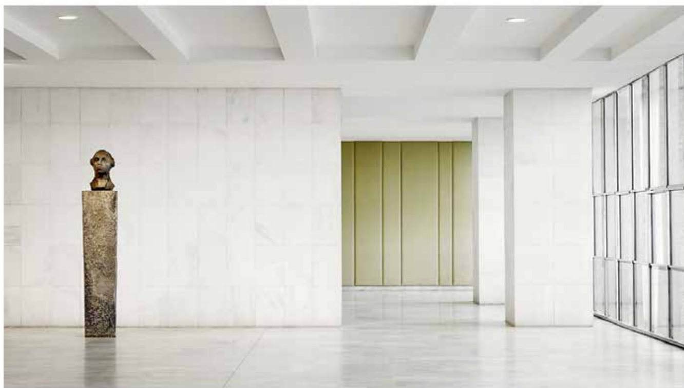
2 — The Itamaraty Palace Foreign relations Ministry, Treaty Room, 2012