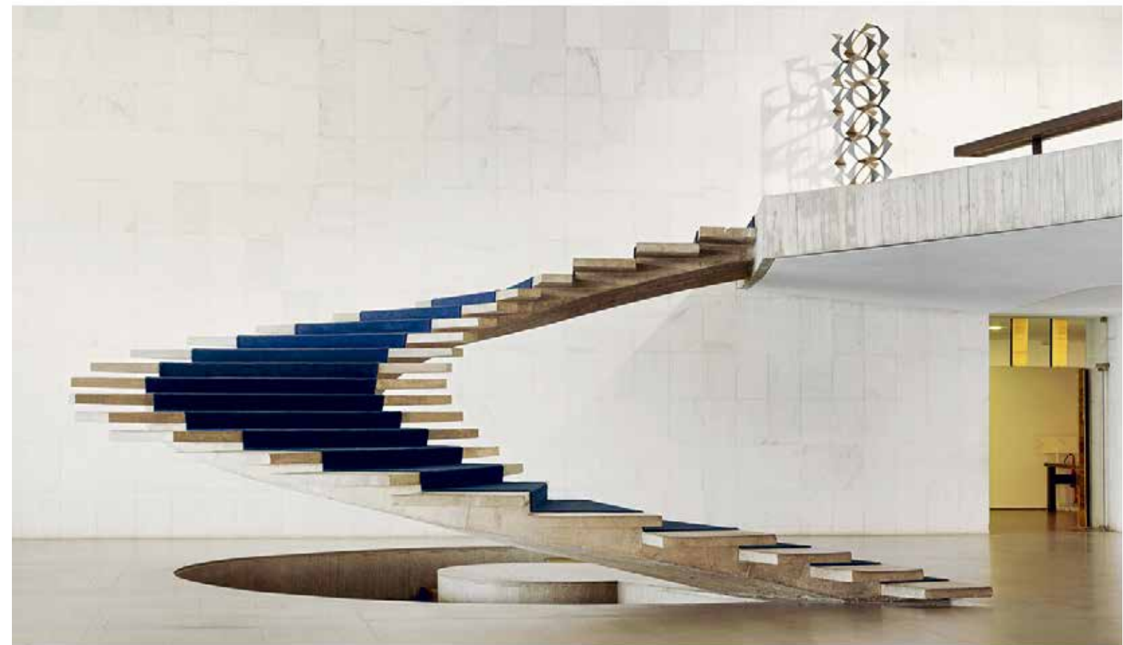
14 — The Itamaraty Palace, Foreign Relations Ministry, Spiral Stairs, 2012

A book on this series of photographs, with contributions by Christian Larsen and Beatrice Galilee, Associate Curator of Architecture and Design at The Metropolitan Museum of Art, will be published by Noeve in 2019