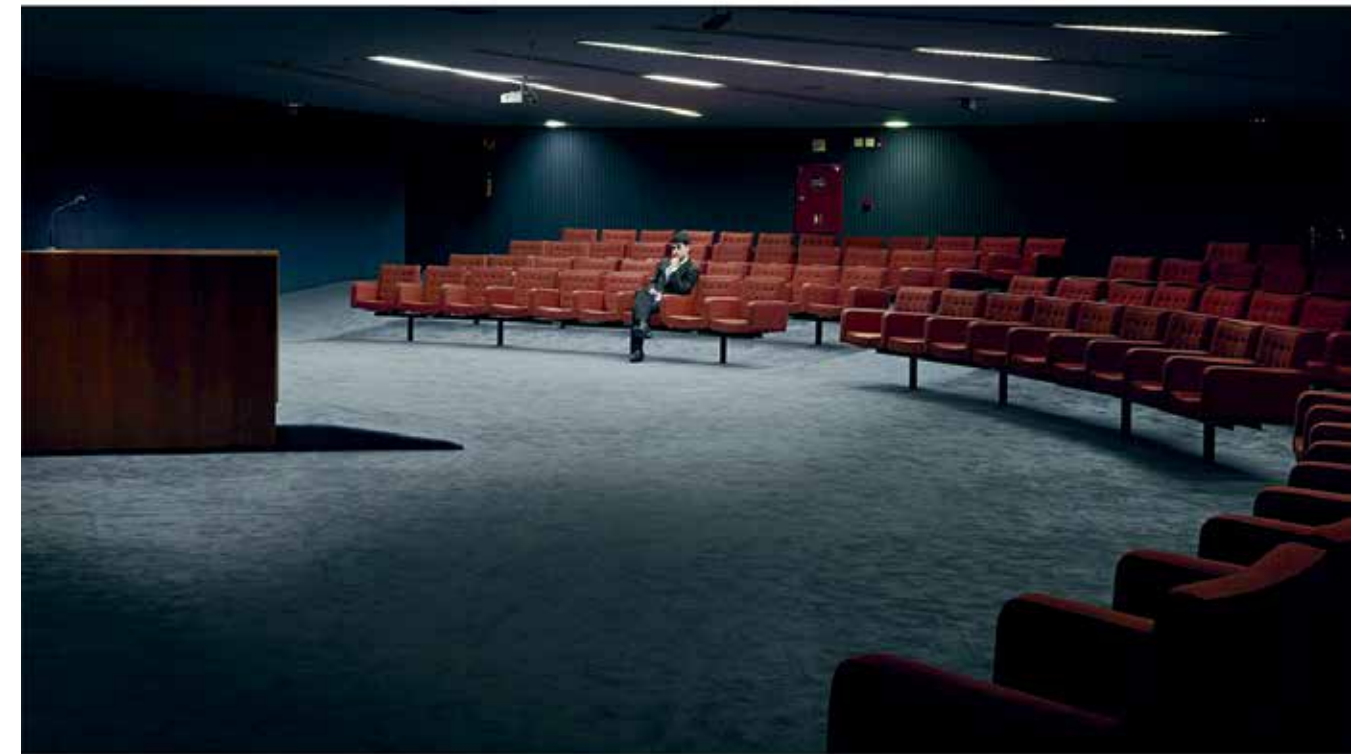
6 — Federal Supreme Court Palace, 2012