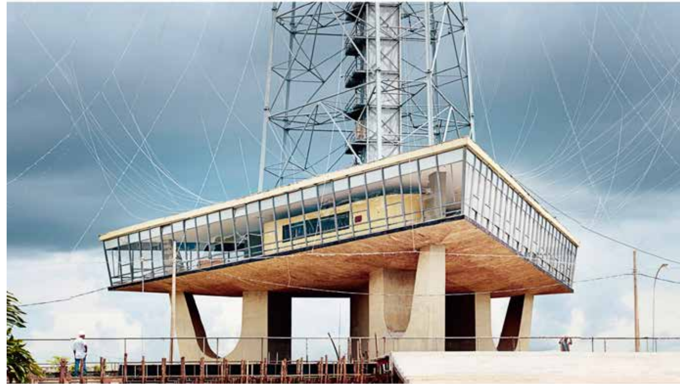
12 — TV Tower, Brasília, 2012

My interest in Brasília also comes from my fascination with myths and stories that question and explore the future, from science to architecture, to technology. All my projects: space exploration, humanoid robots, the transformation of life through technology or even utopian architecture have in common to imagine the future in a historical perspective, as an archaeologist who dates different time strata. It may be the future of the past, or of a future very near, almost parallel to our present, or even of a possible future, a fantasized anticipation. The