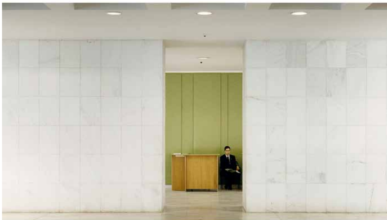
3 — The Itamaraty Palace, 2012

TLmag: J'y ai eu la même impression que vous : celle d'un vaste paysage horizontal. Ses bâtiments, ses proportions, tout semble y mettre l'horizon en valeur, à la façon d'un point de fuite. Votre choix d'un format horizontal m'a donc semblé très judicieux. J'imagine que vous y êtes avant tout allé pour découvrir les constructions et leurs espaces. Votre sélection pour TLmag laisse penser que vous n'y avez guère rencontré de surprises ; vous est-il malgré tout arrivé d'entrer dans un bâtiment et d'y être frappé par un moment de beauté fugace que vous n'aviez jamais vu en photographie ? On connaît par exemple l'escalier en colimaçon d'Itamaraty, mais on voit rarement le treillis d'Athos Bulcão, qui forme un écran/une barrière spatiale et visuelle à son sommet. Qu'en pensez-vous ?