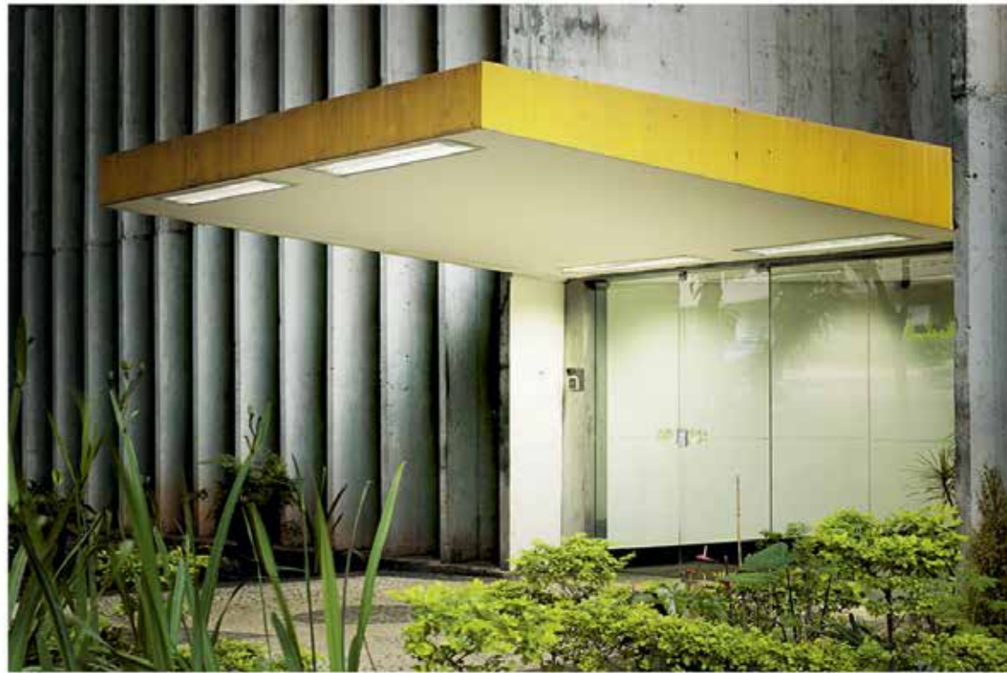
4 — North Super Block 107, Building I 185, 2012

en un langage global, une vision unique, mais ce désir se heurte toujours à la réalité. Prenons l'exemple des superquadras : censés vivre dans ces milieux autonomes, les habitants n'ont pas voulu s'y confiner et ont recherché la diversité. Les superquadras n'ont pas fonctionné comme prévu, mais constituent un admirable rêve que je respecte profondément. Les utopies sont nécessaires pour repenser le champ des possibles et bouleverser les normes. L'esthétique de la ville de Brasília continue de me fasciner: tout y est parfaitement cadré et composé. Le vide lui-même y trouve sa place, dans un dialogue avec le plein.