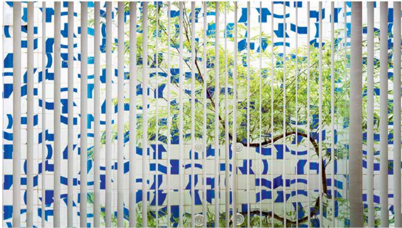
8 — Green Hall at the National Congress Palace, ceramic tile by Athos Bulcão, 2012