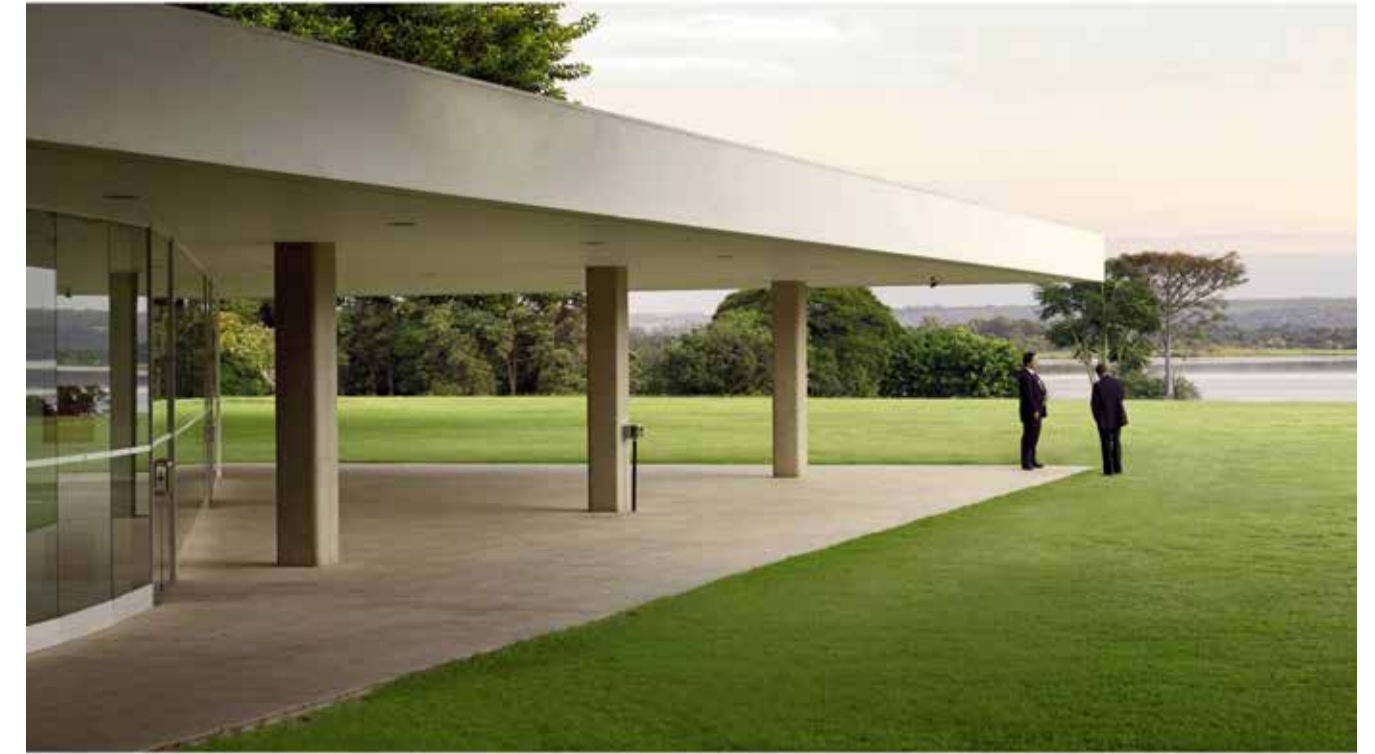
13 — Brasília Palace Hotel, Paranoa Lake, Brasília, 2012

novel “Fiction” from Jorge Luis Borges where “the cartographers guilds struck a map of the empire whose size was that of the empire, and which coincided point for point with it. Everything is organized in a very mathematical way of seeing space, very abstract, like if the physical world would have been absorbed within a mathematical world. There is a contradiction in this as well. As a guiding concept, Oscar Niemeyer wanted to create a city that was meant to be shared, everyone in it together. But the opposite happened. Instead of drawing people