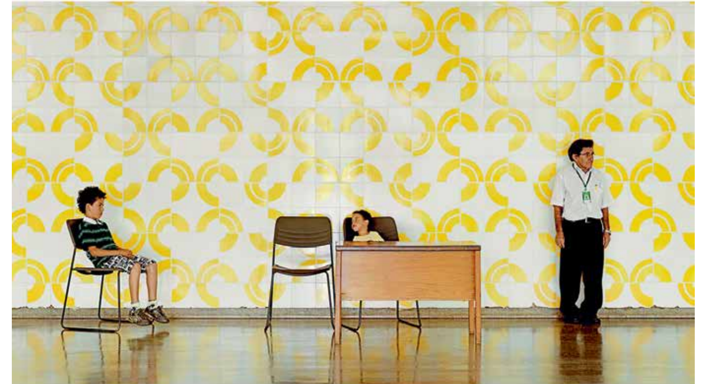
11 — The Claudio Santoro National Theater, ceramic tile by Athos Bulcão, 2012